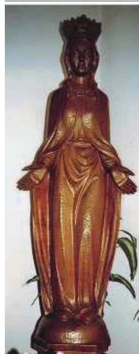
Marienstatue in St. Marien Höven

Für entsprechende Fahrgelegenheit möge bitte jeder selbst sorgen.