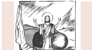
Ostersonntag: Im Glanz der Auferstehung

19.30 Uhr Entzünden der Flamme mit Gang zum Osterfeuer