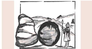
Karsamstag: Im Dämmerlicht der Hoffnung

21.00 Uhr Osternachtsfeier, beginnend mit dem Ent- zünden der Osterkerze vor der Kirche